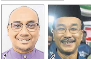
罗西迪/希盟公正党 祖基菲巴卡/国盟土团党

选民人数 28,170 华 19.79% 巫 77.85% 印 1.79% 其他 0.57%