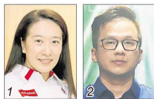
彭心慈/希盟行动党 张振祥/国盟伊党支持者大会堂

选民人数 35,904 华 85.87% 巫 6.42% 印 7.47% 其他 0.24%