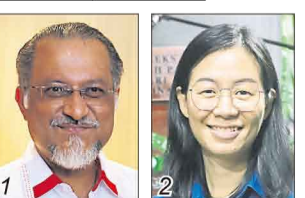
佳日星/希盟行动党 王煦棧/国盟民政党

选民人数 26,791 华 56.53% 巫 28.83% 印 14.11% 其他 0.53%