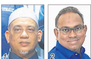
莫哈末弗兹/国盟伊党 赛胡先/国阵巫统

选民人数 28,100 华 14.53% 巫 83.01% 印 2.17% 其他 0.29%