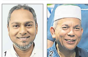
再努丁莫哈末/希盟公正党 布卡里/国盟伊党

选民人数 34,723 华 20.29% 巫 75.92% 印 3.56% 其他 0.23%