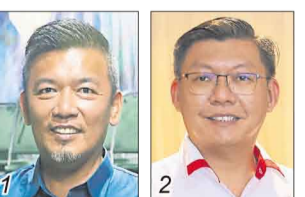
谢锦发/国盟土团党臂膀组织 郑来兴/希盟行动党

选民人数 15,532 华 81.45% 巫 10.17% 印 7.88% 其他 0.50%