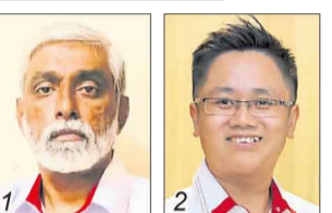
苏达卡仁/国盟民政党 王宇航/希盟行动党

选民人数 21,568 华 92.12% 巫 1.69% 印 6.01% 其他 0.18%