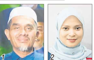
诺查比利/国盟伊党 努希达雅/希盟公正党

选民人数 38,409 华 22.18% 巫 61.06% 印 16.42% 其他 0.34%