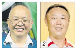
王权仁/国盟土团党臂膀组织 朱悦权/希盟行动党

选民人数 32,529 华 69.36% 巫 14.74% 印 15.49% 其他 0.41%