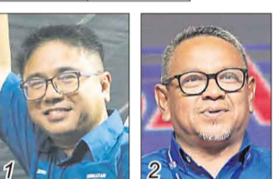
祖基菲依布拉欣/国盟土团党 拉希迪/国阵巫统

选民人数 26,095 华 24.95% 巫 67.52% 印 7.44% 其他 0.29%