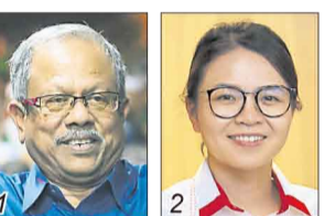
莫汉/国盟土团党臂膀组织 陈汇萍/希盟行动党

选民人数 31,574 华 65.54% 巫 22.31% 印 11.39% 其他 0.76%