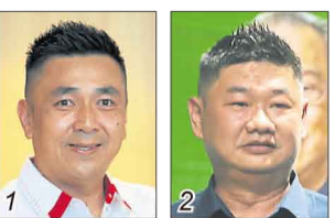
方美铼/希盟行动党 高天佑/国盟伊党支持者大会堂

选民人数 36,601 华 55.43% 巫 19.50% 印 24.84% 其他 0.23%