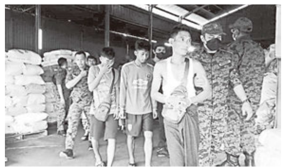
外勞被帶返檳州移民局總部等待調查。