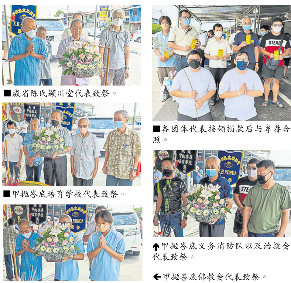
■威省陳氏頴川堂代表致祭。 ■各團體代表接領捐款後與孝眷合照。 ■甲拋峇底培育學校代表致祭。 ▲甲拋峇底義務消防隊以及治教會代表致祭。 ◀甲拋峇底佛教會代表致祭。