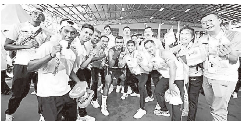
檳州選手得到好成績，與多位議員分享喜悅。