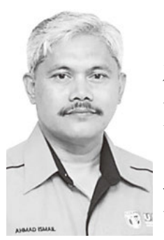
負荷。是否安全和承載是否慎重考量3個蓄水池的結構。阿末依斯邁：州政府須