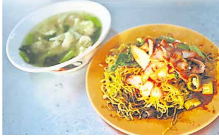
■妖怪云吞面不只便宜，来这里吃面吃的不仅是他们怀念的味道，还有那一份人情味。