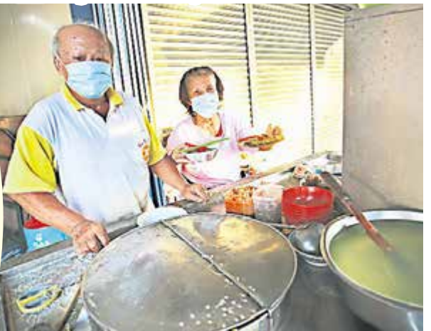
■阿快叔及金菊姨夫妻是“妖怪云吞面”的生招牌，食客来到只认他俩。