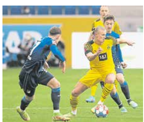
■哈蘭德(右)的傷勢可能讓他缺陣2-6週的時間。

(柏林26日讯)在上周末对霍芬海姆的德甲比赛中，哈兰德为多蒙特攻入了首开纪录的进球。然而，在第63分钟时，他却因伤离场。赛后，多蒙特官方表示，哈兰德遭遇肌肉伤病，未来几天将再次接受检查和治疗。周二，德国《天空体育》消息称，哈兰德遭