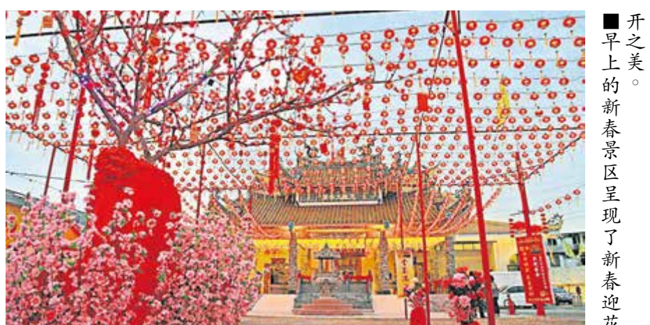
■开之美的。早上的新春景区呈现了新春迎花