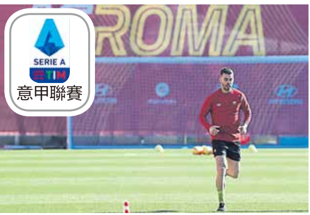
■去年欧洲杯期间受伤的斯皮纳佐拉周二正式恢复场上训练。

去年夏天的欧洲杯上表现非常出色，入选了欧洲杯最佳阵容，被誉为又一名“伟大的意大利左后卫”。不过，在7月3日意大利对比利时的比赛中，他跟腱断裂被换下，之后他接受了手术并一直缺席至今。上周，斯皮纳佐拉接受了主治医生的最新诊断，确认他的伤势已康复。如今，他已恢复训练，并且希望逐步找回状态。此前曾有报道称，斯皮纳佐拉有望在2月份复出参赛，这对罗马和意大利国家队都是好消息。