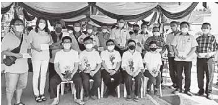
■ 受惠团体代表接领献金后与郑府孝眷合影。

于公元2022年1月17日(农历辛丑年十二月十五日)寿终正寝，享寿积闰83岁，遗下孀妻姚松花，3男2女暨内外孙辈满堂，堪称福寿全归。郑达源老先生遗孀，经于1月21日举殯，安葬于大山脚双溪里武灵应社义庄。郑府平素交游广阔，举殯之日，居丧不忘慈善社会公益，特节约丧费捐助下列18个受惠团体，计有威省郑潘池荣阳堂，槟榔屿郑氏荣阳堂妇女组，青年团，北海灵应社，北海马华公会峇眼区会，北海马华峇眼区会妇女组，槟州北海明义善社，北海新芭观音亭斗母宫，林连玉基金，威省慈联洗肾中心，北海天公坛，北海双溪浮油灵星堂，北海心莲心慈善之家，檳城