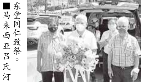
■ 东堂同仁致祭。马来西亚吕氏河